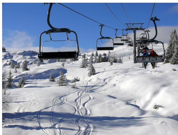
Ski aux Aillons Margériaz