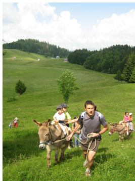
Randonnée avec un âne aux Creusates (Saint François)

L'Office de tourisme, c'est vous. L'équipe des salariées et bénévoles met en place des supports de communication variés pour promouvoir et vendre votre territoire et ces produits. Il est important que vous nous fassiez part de vos critiques et suggestions et qu'ensemble nous avançons dans une Démarche Qualité afin de proposer les meilleures prestations à nos visiteurs.