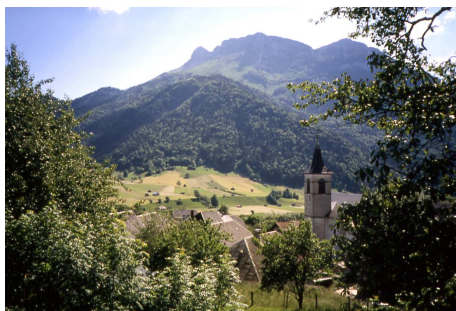
La Compôte en Bauges

Pour adhérer, vous devez vous acquitter d'une cotisation annuelle. Pour les propriétaires de locations de vacances, si vous souhaitez adhérer, votre logement doit préalablement être classé (par les Gîtes de France ou Clé vacances ou par nos soins selon les normes préfectorales).